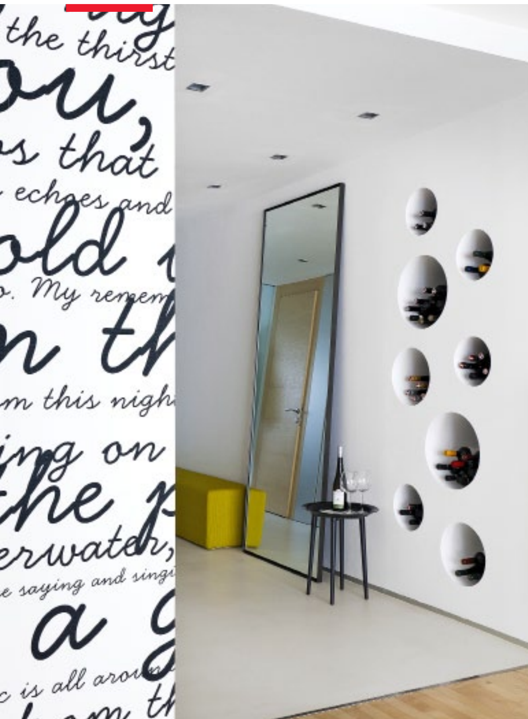
▲ Atraktivní kruhové niky slouží k ukládání vína. Vznikly z kanalizačního potrubí různých průměrů

jen částečná příčka zhotovená z luxfer. Přibyla v ní nová zrcadlová stěna a speciální betonové umyvadlo, které je vizuálně sladěno s rámem vany. Na zakázku se do ložnice vyráběla postel, kterou jsme umístili do středu místnosti a oddělili tak šatní zónu se skříní. Z druhé strany je v čele lůžka umístěný vzhledově nepřitažlivý mixážní pult s reproduktory a pracovní stůl, který jinak zůstává prakticky skrytý. Součástí je zabudované osvětlení a zbylo v něm ještě místo pro další úložné zásuvky. Z boku na šatnu navazuje WC spojené s technickou místností, kde je například pračka.