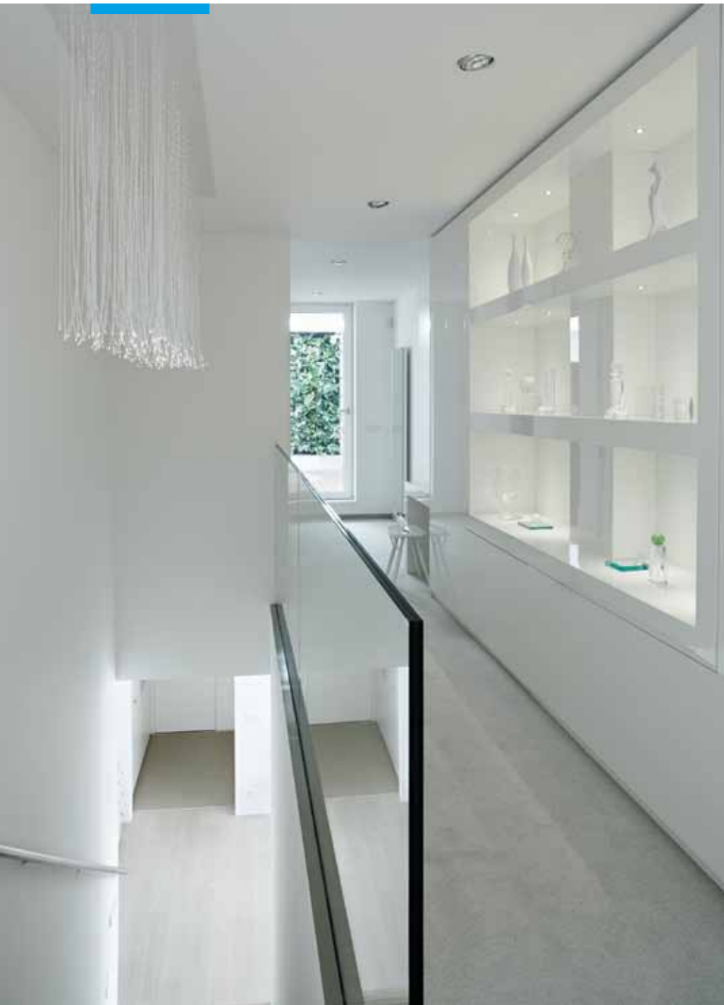
▲ Stropní svítidlo Rain z optických vláken navrhla designérka Ivanka Kowalski speciálně pro osvětlení schodiště. Podlahu v patře kryje světlý koberec

korace. Barevný motiv motýlů zdobí koupelnu i toaletu v přízemí a doprovází i další nábytek a doplňky umístěné v hale. Do těch jsem se zaměřovala na první pohled.