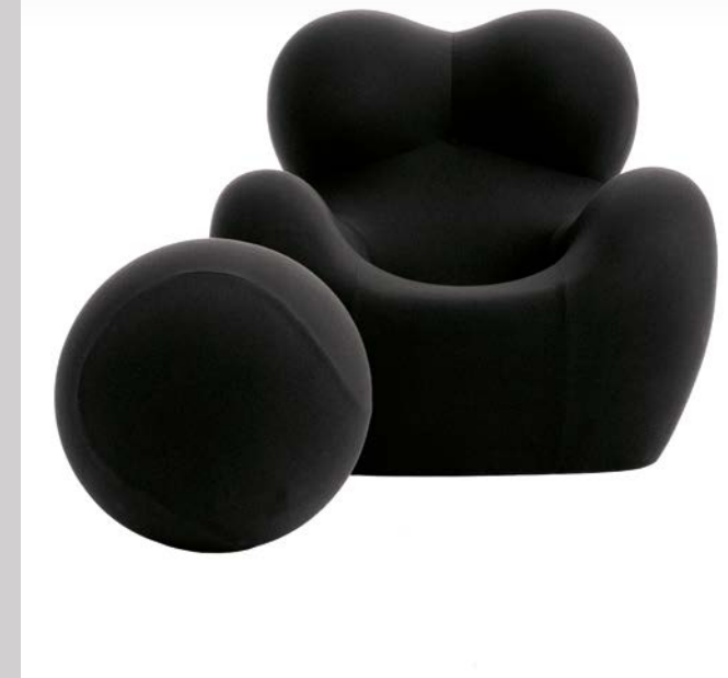
B&B Italia, Křeslo UP design Gaetano Pesce