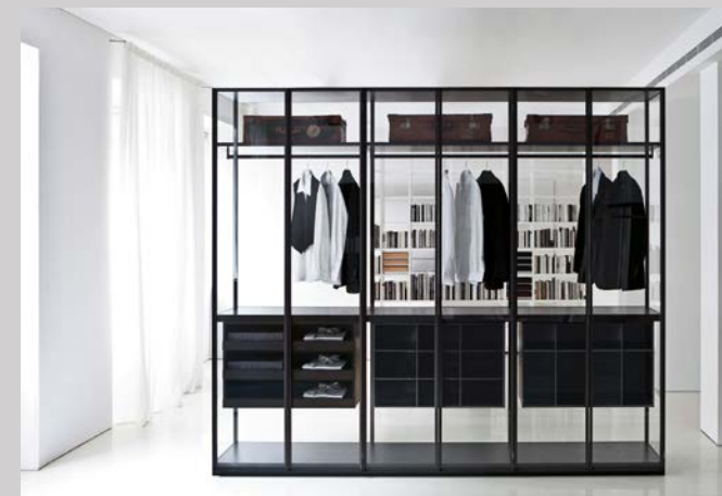
Porro, Šatna Air design Piero Lissoni