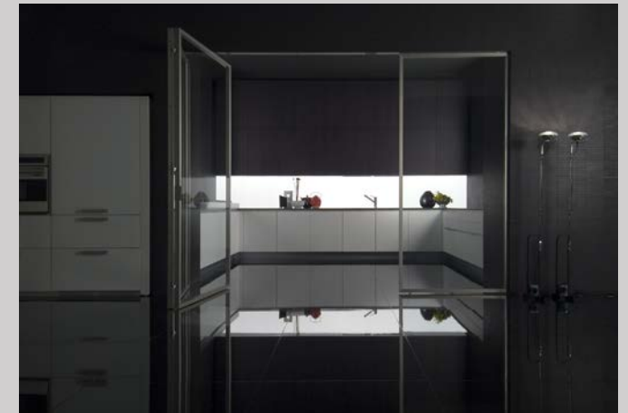
Boffi, Kuchyně Xila design Luigi Massoni